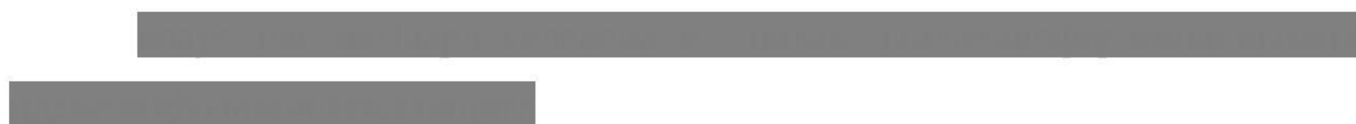
Рисунок 1 - Классификация угроз экономической безопасности

На рисунке 1 представлена классификация угроз экономической безопасности региона.