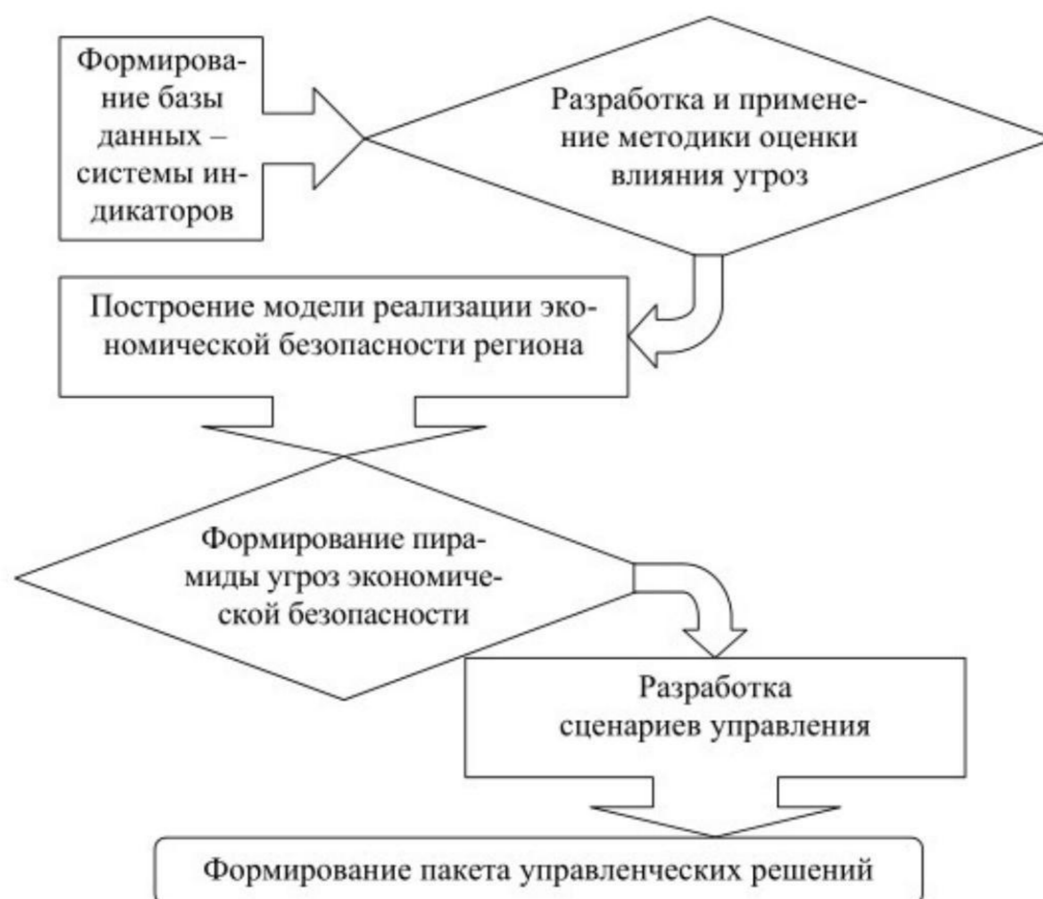
Рисунок 2 - Схема принятия управленческих решений в процессе реализации механизма управления экономической безопасностью 1

Механизм управления, имеющий в основе модель реализации экономической безопасности региона, обладает рядом преимуществ: