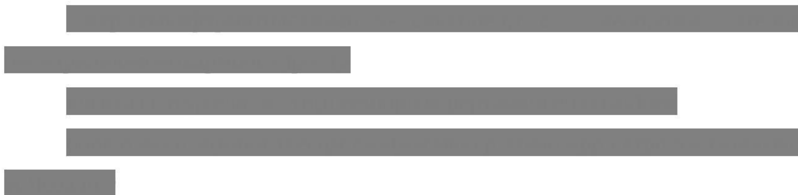
Рисунок 4 - Система соотношений показателей экономической безопасности на макро-, мезо- и микроуровне

между регионами и центром и между самими регионами. По масштабам влияния можно выделить следующие показатели экономической безопасности: